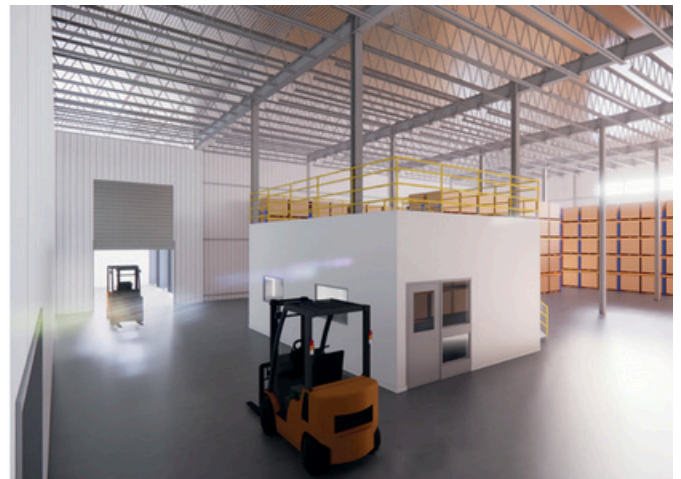
Intérieur de l'agrandissement