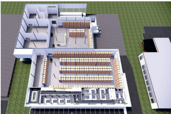
À l'arrière : agrandissement À l'avant : bâtiment existant